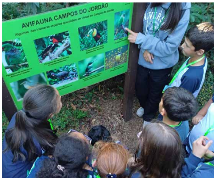
Crianças aprendem ESG (questões ambientais, sociais e de governança) nas escolas em Campos do Jordão (SP): programa inédito da Play Recycling educa para um futuro verde e coletivo.

e no ensino fundamental, com atuação em 7 Estados e mais de mil alunos impactados e foi recém-implementado na rede pública de Campos do Jordão, interior de São Paulo.