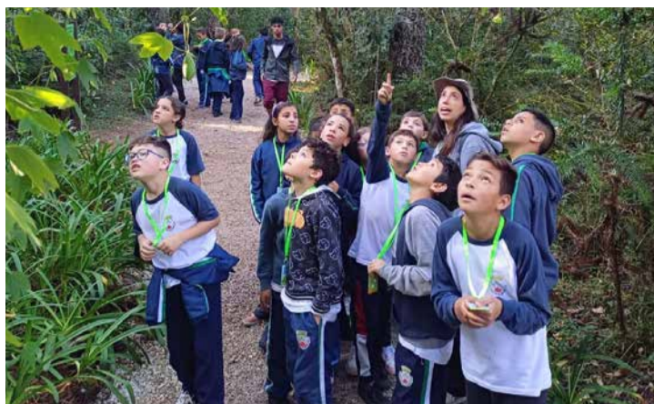
Crianças da Escola Municipal Frei Orestes, em Campos do Jordão (SP), recebem crachá personalizado de agentes ambientais, durante a Semana da Criança.

Crescer com responsabilidade socioambiental. Esse é o objetivo pedagógico da Play Recycling, que lança o primeiro e único programa de educação ambiental do país para crianças de 2 a 12 anos e com duração de 3 anos. O projeto já faz parte da grade curricular de 10 escolas por todo o país na educação infantil